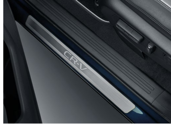
KAPI EŞİK KAPLAMALARI