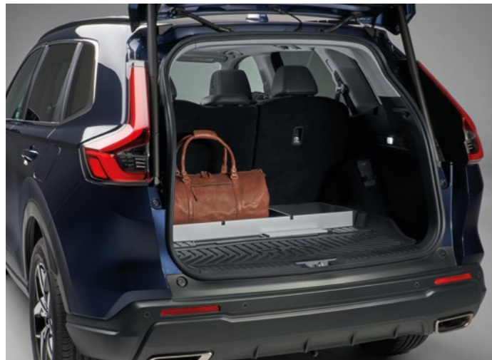
BÖLMELİ BAGAJ ZEMİNİ