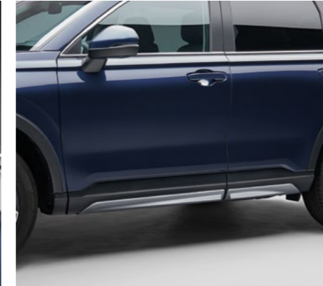
YAN MARŞPIYEL KAPLAMALARI