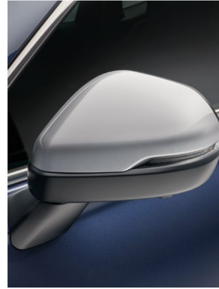
YAN AYNA KAPAKLARI