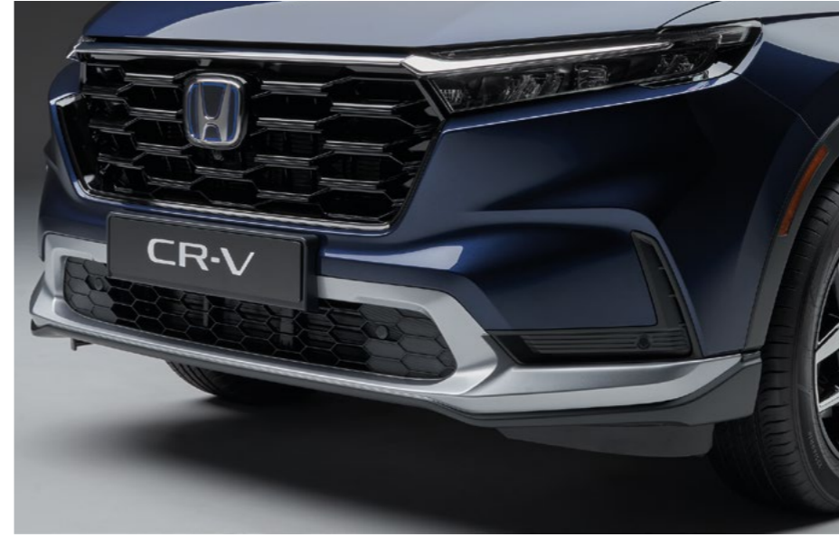
AERO ÖN TAMPON