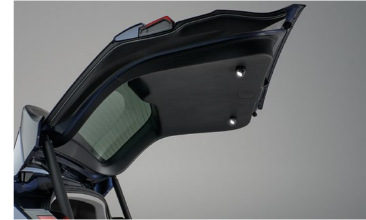
BAGAJ KAPAĞI AYDINLATMASI