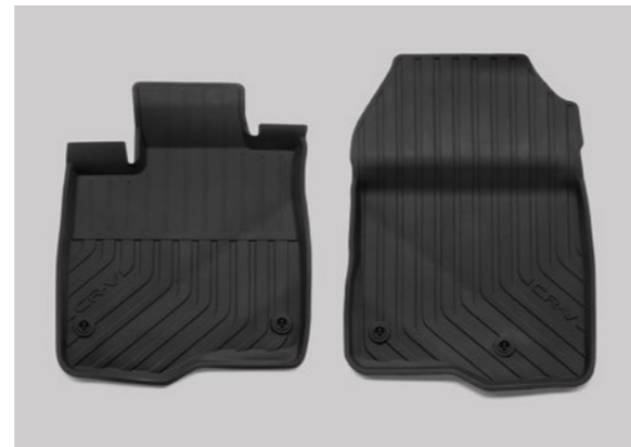
ÖN VE ARKA DÖRT MEVSİM PASPASLAR