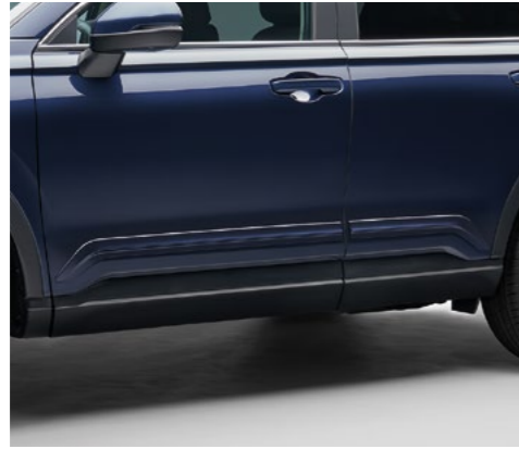
YAN GÖVDE KAPLAMALARI

CR-V'nizi daha şık ve pratik hale getiren Dayanıklılık Paketi, uzun yolculukları tercih edenler için düşünüldü. Paket, Yan Gövde Kaplamaları, Kapı Eşik Kaplamaları, Bölmeli Bagaj Zemini ve Dört Mevsim paspaslar içeriyor.