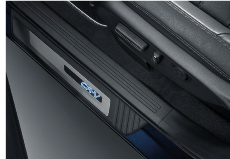
AYDINLATMALI KAPI EŞİĞİ KAPLAMALARI

Aydınlatma Paketi ile otomobilinizi geceleri ön plana çıkarın. Paket, CR-V'nin sofistike görünümünü artıran dış zemin aydınlatması, aydınlatmalı kapı eşik nikelajları, bagaj eşiği dekorasyonları ve iç kapı cebi aydınlatması içerir