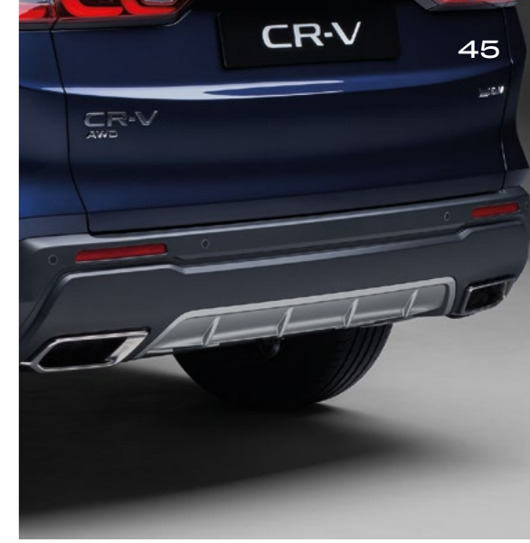
ARKA TAMPON EKİ